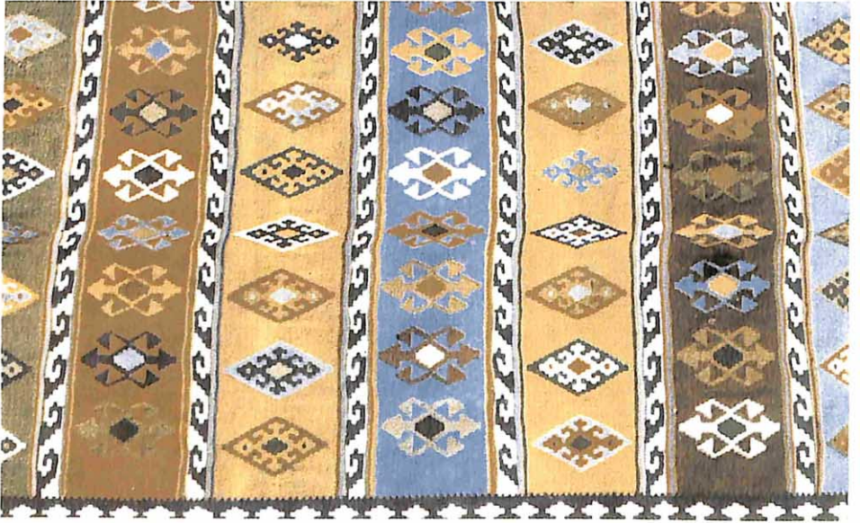
İran Türklerinde bir kilim